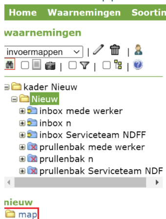
Figuur 1 aanmaken nieuwe map

Selecteer de folder waarin een nieuwe map aangemaakt dient te worden. Klik vervolgens op de knop “map” op het kopje “nieuw”. Geef de aangemaakte map vervolgens een goede naam en druk op Enter.