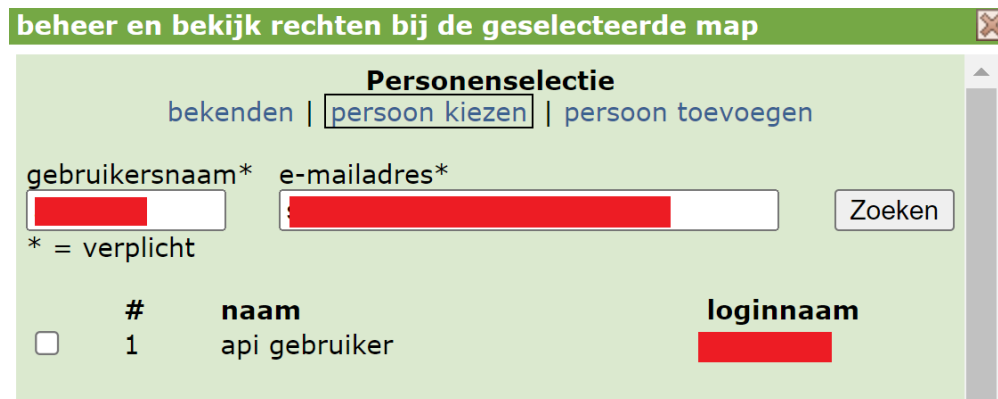
Figuur 3 Zoeken naar personen

Bij het toekennen van de rechten aan de “api gebruiker” is het van belang de juiste api inlognaam te selecteren. Het selecteren van de juiste persoon doet u door in het personen zoek-dialogoog (zie hieronder) de tab “persoon kiezen” te selecteren.