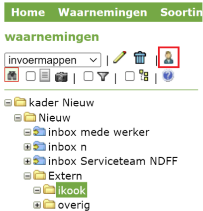
Figuur 5 Folderstructuur voor externe aanleveringen

Stap 1: Aanmaken folders en subfolders voor externen onder de startfolder.